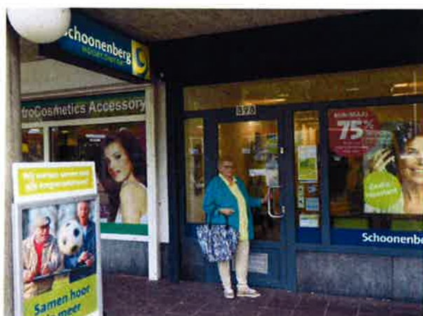
Mevr Rijen aankomst bij hoortoestelwinkel

Collectief: deelnemers die via een collectiviteit (woonzorginstelling of via een dagopvang) een collectief deelnemerschap hebben per wooneenheid.